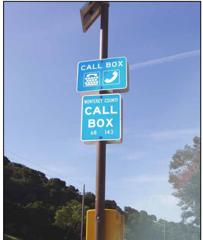
Cajas Telefónicas en la carretera 68*

Estas cajas telefónicas están ubicadas a lo largo de las siguientes rutas: